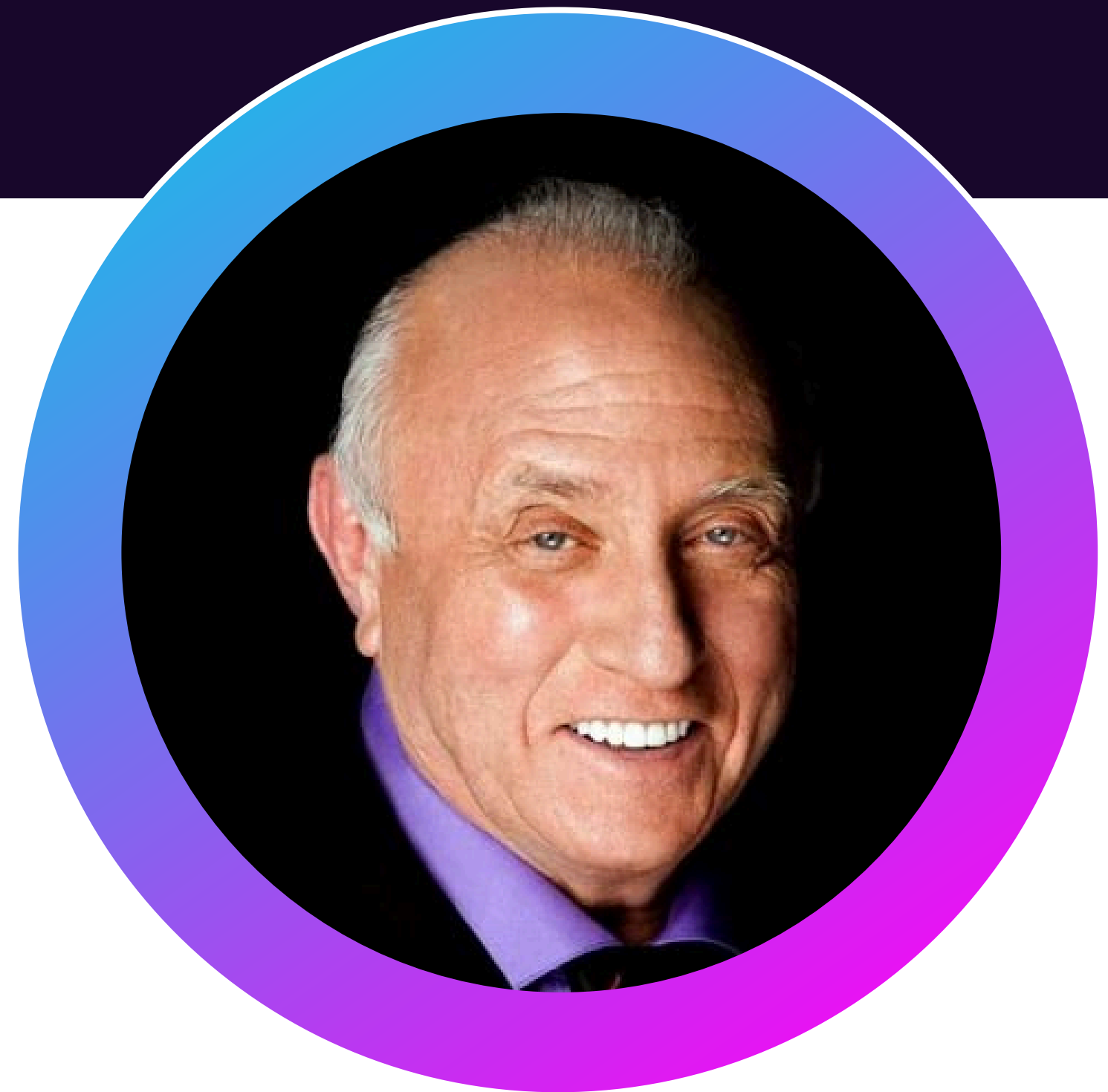
Richard Bandler. Co-creador de la PNL